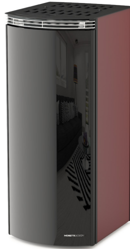
Bordeaux Bordeaux - Bordeaux Bordeos - Bordeaux