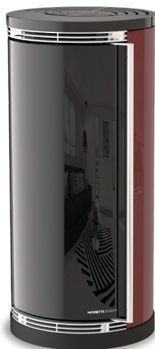
Bordeaux Bordeaux - Bordeaux Bordeus - Bordeaux