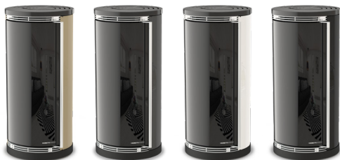
Champagne Champagne - Champagne Champân - Champagner

Rear Exhaust Fume Outlet - Salida De Humos Trasera - Sortie De Fumée Arrière - Rauchausgang Hinten - Top Exhaust Fume Outlet - Salida De Humos Superior - Sortie De Fumée Supérieur - Rauchausgang Oben - Seitlicher Rauchausgang