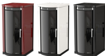
Bordeaux Bordeaux - Bordeaux Bordeaux - Bordeaux Bianco White - Blanc - Blanco - Weiß Nero Black - Noir - Negro - Schwarz

Ventilazione Frontale - Uscita Fumi Posteriore Front Ventilation - Rear Exhaust Fume Outlet - Ventilation Avant - Sortie De Fumée Arrière - Ventilación Frontal - Salida De Humos Trasera - Front Gebläse - Rauchausgang Hinten