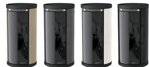
Champagne Champagne - Champagner Champán - Champagner Canna di Fucile Gummelal - Bronze à Canon Gummelal - Rotguss Bianco White - Blanc - Blanco - Weiß Nero Black - Noir - Negro - Schwarz

Ventilazione Frontale - Uscita Fumi Posteriore Front Ventilation - Rear Exhaust Fume Outlet - Ventilation Avant - Sortie De Fumée Arrière - Ventilación Frontal - Salida De Humos Trasera - Front Gebläse - Rauchausgang Hinten