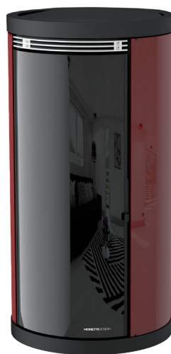
Bordeaux Bordeaux - Bordeaux Burdeos - Bordeaux