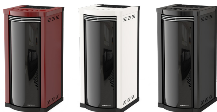
Bordeaux Bordeaux - Bordeaux Bordeaux - Bordeaux

Front Ventilation (1 Motor) - Rear Exhaust Fume Outlet - Ventilación Frontal (1 Motor) - Salida De Humos Trasera - Ventilation Avant (1 Moteur) - Sortie De Fumée Arrière - Front Gebläse (1 Motor) - Rauchausgang Hinten - Top Exhaust Fume Outlet - Salida De Humos Superior - Sortie De Fumée Supérieur - Rauchausgang Oben - Seitlicher Rauchausgang