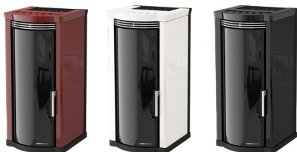
Bordeaux Bordeaux - Bordeaux Bordeaux - Bordeaux

Front Ventilation (1 Motor) - Rear Exhaust Fume Outlet - Ventilación Frontal (1 Motor) - Salida De Humos Trasera - Ventilation Avant (1 Moteur) - Sortie De Fumée Arrière - Front Gebläse (1 Motor) - Rauchausgang Hinten - Top Exhaust Fume Outlet - Salida De Humos Superior - Sortie De Fumée Supérieur - Rauchausgang Oben - Seitlicher Rauchausgang