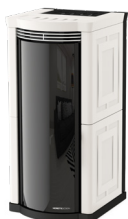
Bianco White - Blanc - Blanco - Weiß