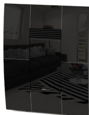
Nero Black - Noir - Negro - Schwarz

Potenza Globale Global Power Puisance globale Potencia global Verbrennungsleistung