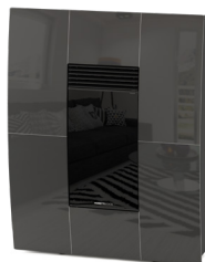
Canna di Fucile Gurmettal - Bronze à Canon Gunmetal - Rotguss