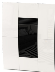
Bianco White - Blanc - Blanco - Weiß