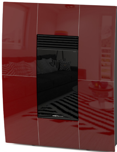
Bordeaux Bordeaux - Bordeaux - Bordeaux - Bordeaux

Ventilazione Frontale (1 Motore) - Uscita Fumi Superiore - Uscita Fumi Posteriore - Uscita Fumi Laterale