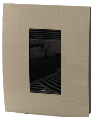
Champagne Champagne - Champagne Champän - Champagner