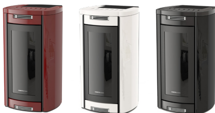
Bordeaux Bordeaux - Bordeaux Bordeaux - Bordeaux

2 Rear Outlets (2 Motors) - Front Ventilation (1 Motor) - Rear Exhaust Fume Outlet - 2 Salidas Traseras (2 Motores) - Ventilación Frontal (1 Motor) - Salida De Humos Trasera - 2 Sorties Arrière (2 Moteurs) - Ventilation Avant (1 Moteur) - Sortie De Fumée Arrière - 2 Ausgänge Hinten (2 Motore) - Front Gebläse (1 Motor) - Rauchausgang Hinten