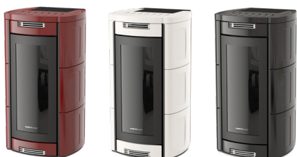
Bordeaux Bordeaux - Bordeaux Bordeaux - Bordeaux

2 Rear Outlets (2 Motors) - Front Ventilation (1 Motor) - Rear Exhaust Fume Outlet - 2 Salidas Traseras (2 Motores) - Ventilación Frontal (1 Motor) - Salida De Humos Trasera - 2 Sorties Arrière (2 Moteurs) - Ventilation Avant (1 Moteur) - Sortie De Fumée Arrière - 2 Ausgänge Hinten (2 Motore) - Front Gebläse (1 Motor) - Rauchausgang Hinten